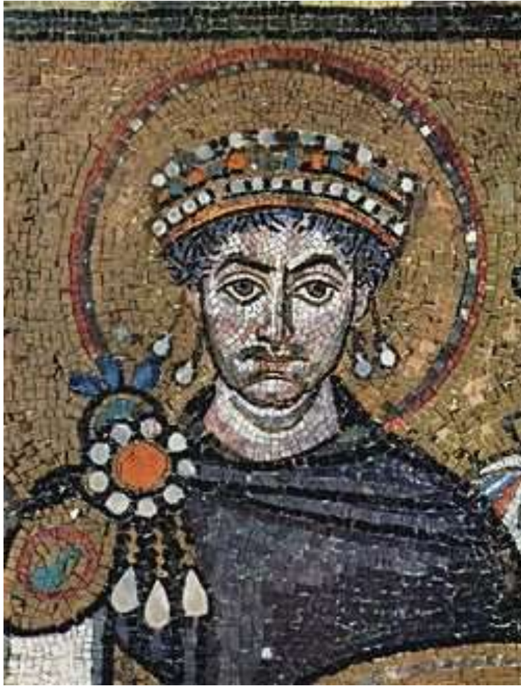
Юстиниан в старости

Юстиниан получил власть в очень трудное время: от бывших владений осталась малая часть, в церкви начались разногласия, местная знать чинила произвол, крестьяне разбегались, в городах проходили бунты, наметился финансовый кризис.